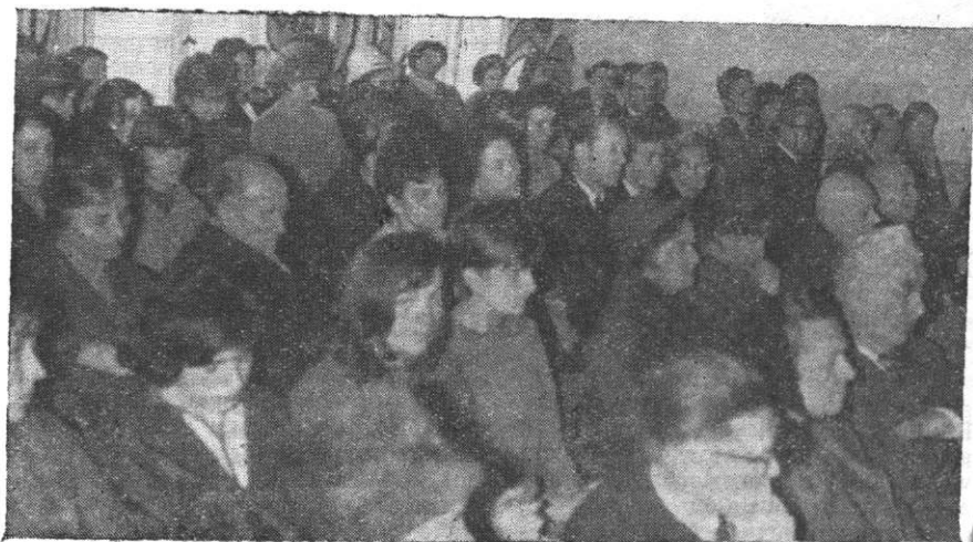
Na sali — uczestnicy I Opolskiego Zlotu Kół Przyjaciół Bibliotek.