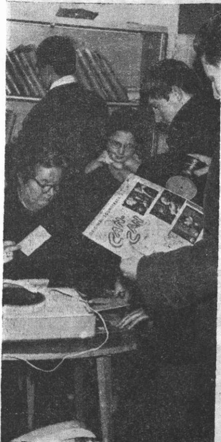
Wypożyczalnia płyt w WiMBP w Opolu cieszy się ogromnym powodzeniem.

Od września 1964 r. przy WiMBP w Opolu czynna jest wypożyczalnia płyt. Na razie płytoteka liczy około 550 płyt i obejmuje muzykę poważną, ludową i taneczną. Prawo do korzystania z niej mają czytelnicy biblioteki. W tej chwili jest takich melomanów 62.